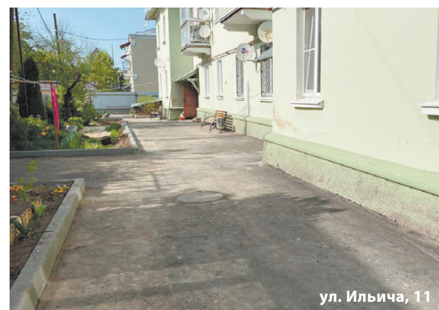
ул. Ильича, 11