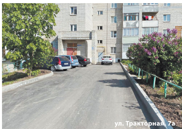
ул. Тракторная, 7а