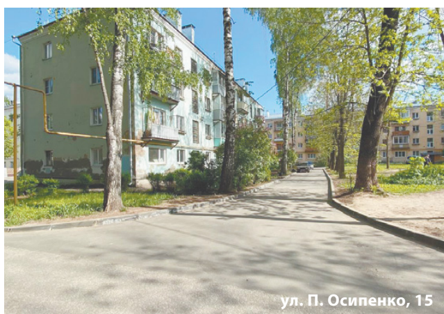
ул. П. Осипенко, 15

На остальных объектах работы по благоустройству продолжаются.