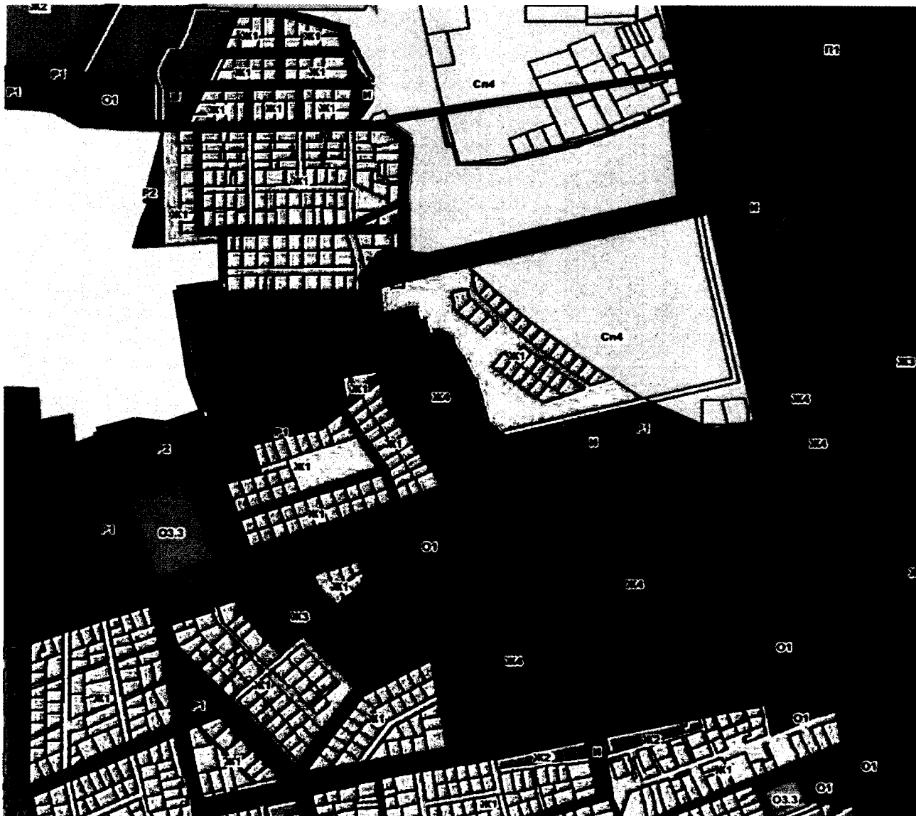
СХЕМА границ территории проектирования

Приложение № 1 к постановлению администрации города Владимира от 27.12.2024 № 3047