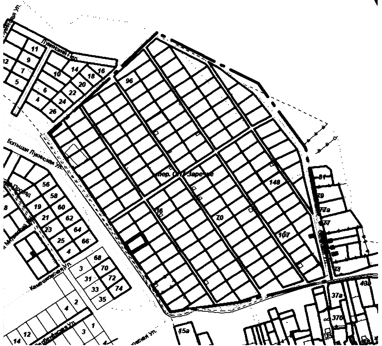
СХЕМА границ территории для проведения общественных обсуждений

Приложение к постановлению главы города от 25.06.2024 № 36